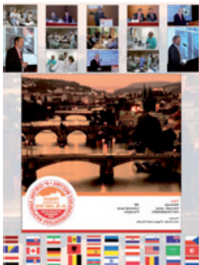
Pozvánka na gastroenterologický kongres

Transplantace jsou jednou ze základních náplní IKEM. Výsledky transplantace jater jsou